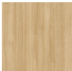
L581 (K) Beauté Naturelle Sheer Beauty