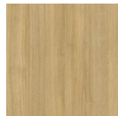
L585 (K) Rhapsodie Rhapsody